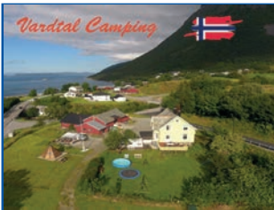
Vartdal camping Tlf nr. 452 00 506

Meir informasjon om prisar, artistane og konsertane finn de på sommarljom.com . Kjøp billett på Tikkio.com